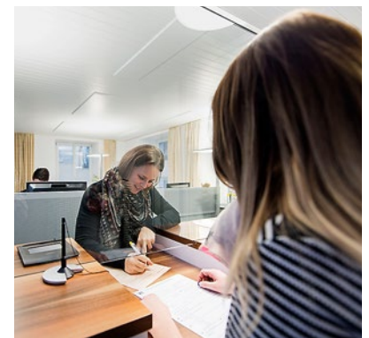
Entfällt: An- und Abmelden am Schalter der Gemeinde

Über eine Karte kann man die Luftqualität an jedem beliebigen Standort abfragen. Die App nutzt die Daten der kantonalen Messstationen und des nationalen Messnetzes. Angezeigt werden die Belastungen durch Feinstaub, Ozon und Stickstoffdioxid. leu