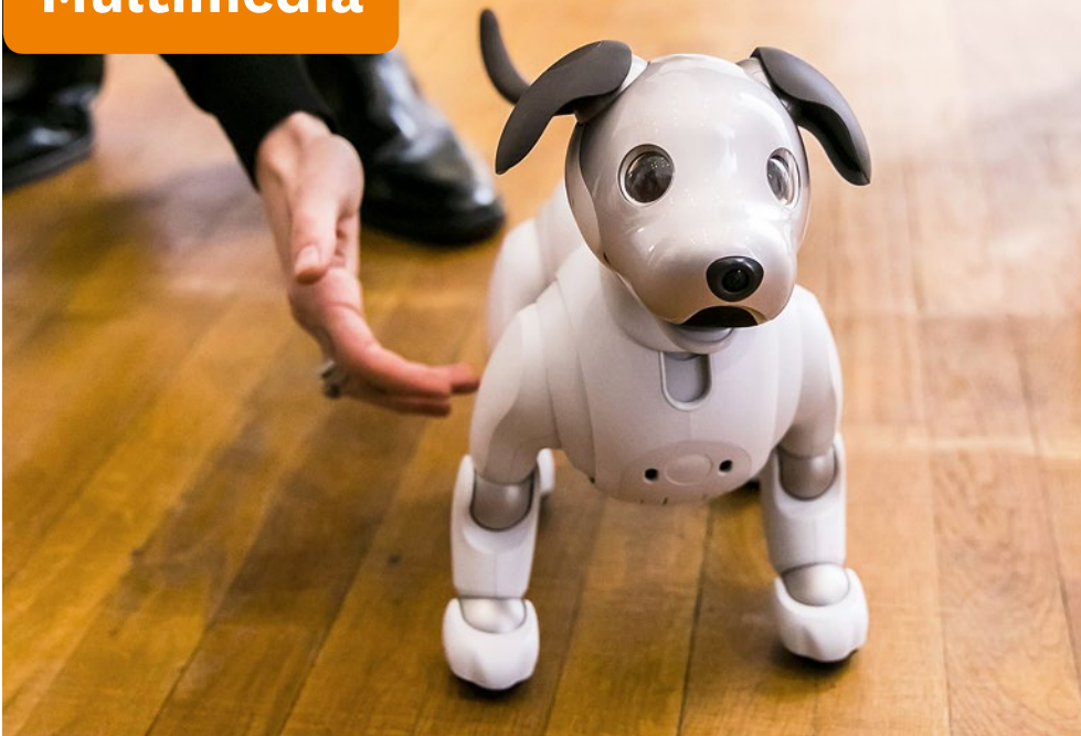
Roboterhund von Sony: Voller Funktionsumfang nur mit Abo