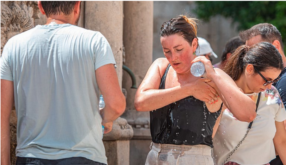
Längere Hitzeperioden: Stress für den menschlichen Körper