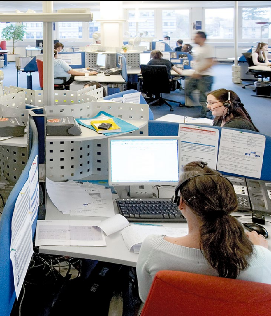
Callcenter: Werbeanrufe kann man unterbinden

Schreiben Sie an: redaktion@saldo.ch , Betreff «Multimedia-Fragen»