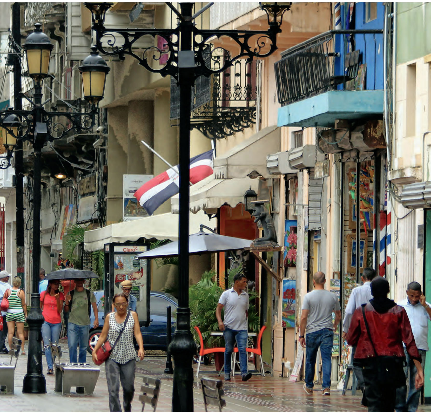
RECHERCHE: JESSICA CARGILL; FOTO: DAVID M BYRNE