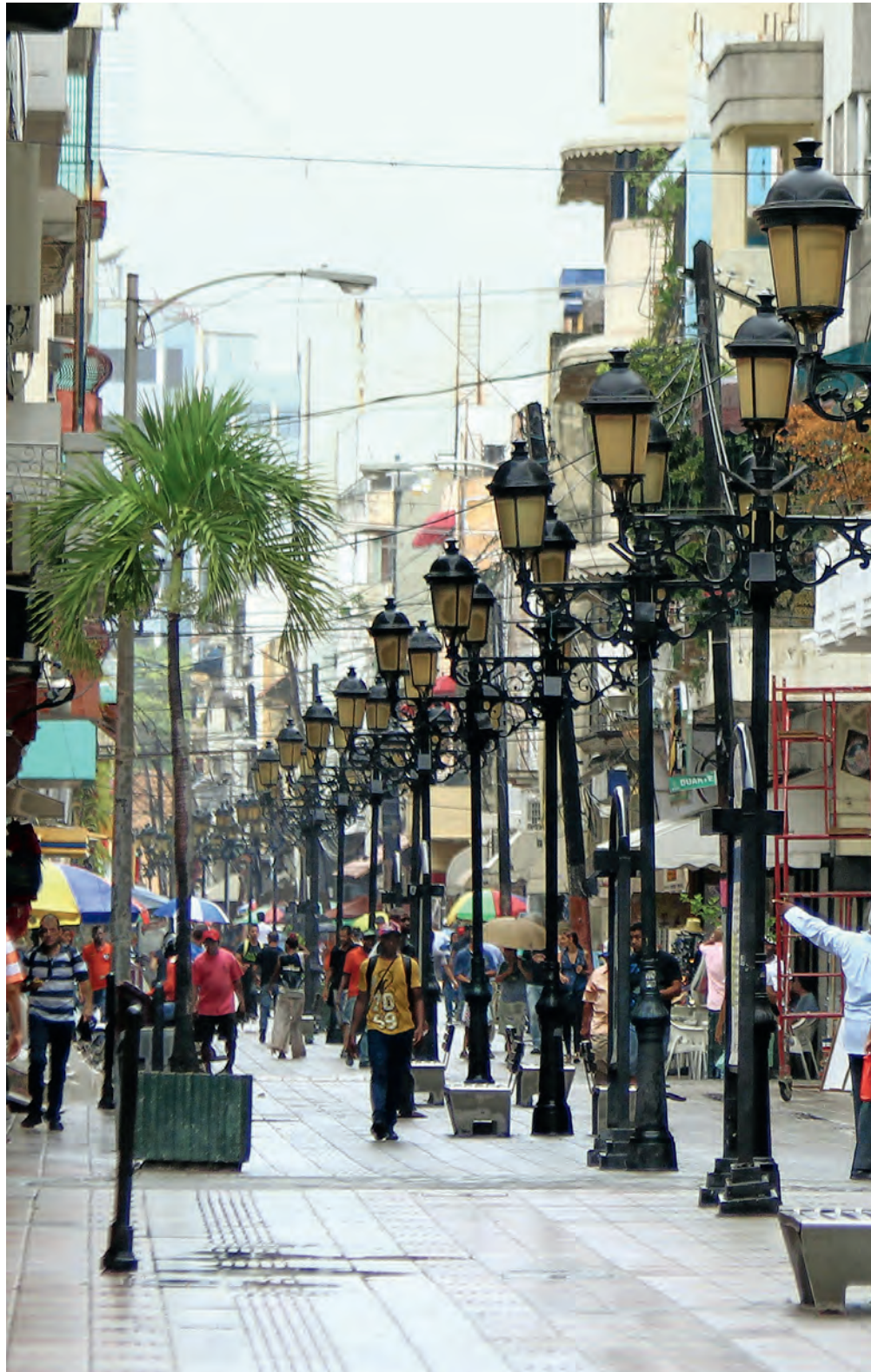
Santo Domingo: Die Fußgängerzone El Conde im Zentrum der Stadt