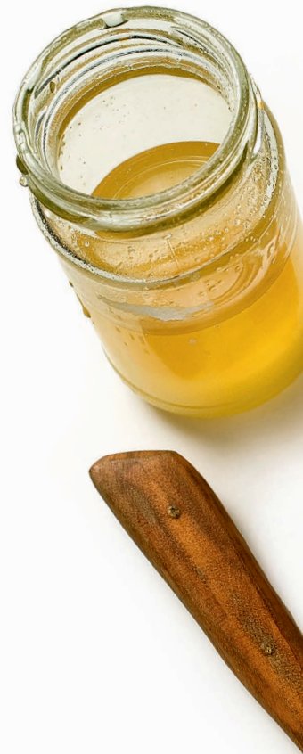
Bienenhonig: Tiefer Wassergehalt verbessert die Haltbarkeit

Bienenkrankheiten wie die Faulbrut oder Varroamilben sind für Imker eine Plage. Bei der Faulbrut handelt es sich um Bakterien, die Bienenlarven angreifen und töten. Die Varroamilben dagegen heften sich an die