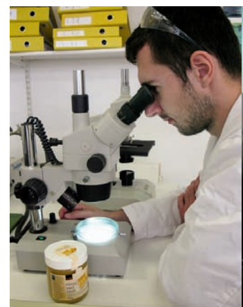
Prüflabor: Wassergehalt zwischen 10

■ Wassergehalt: Den Wassergehalt massen die Experten mit einer sogenannten Refraktometrie.