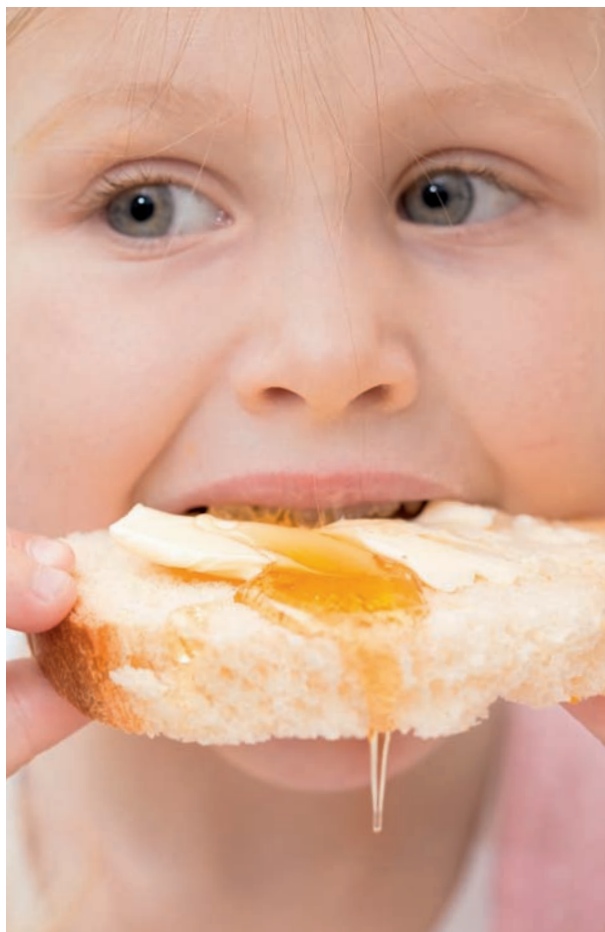
Unbedenklich: Keine unzulässigen Rückstände

Dabei wird der Honig leicht erwärmt und in flüssigem Zustand auf ein Messgerät gegeben, das sodann den Wassergehalt anzeigt.