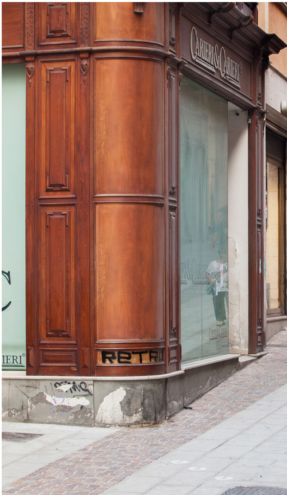
Einkaufsbummel: Via G. Manno in der Hauptstadt der autonomen Region Sardinien