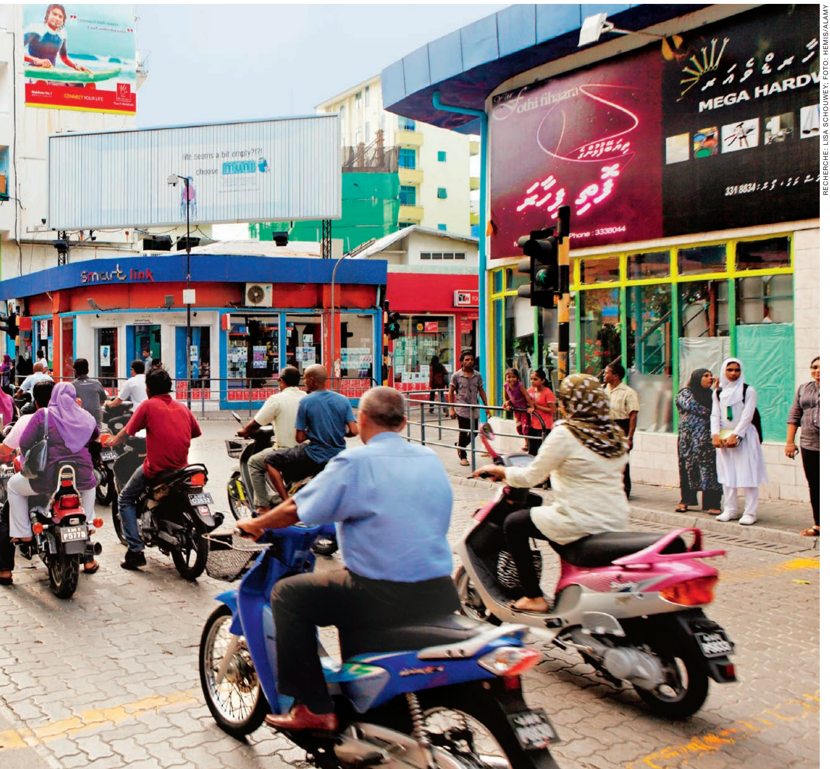
RECHERCHE: LISA SCHOUWEY