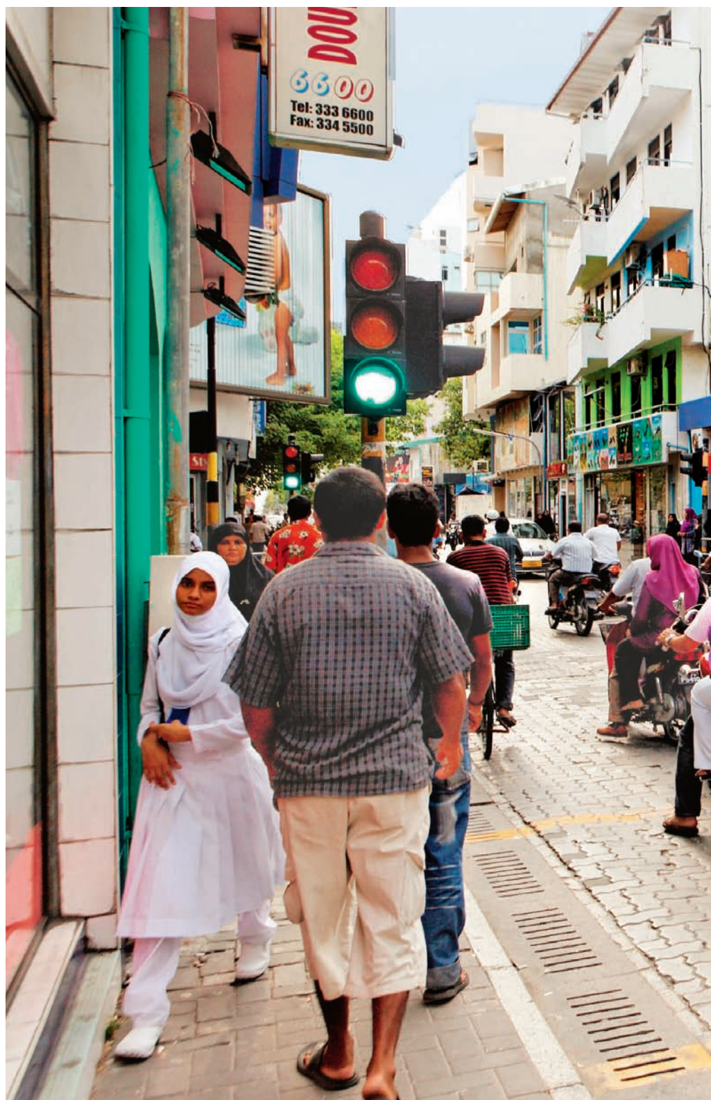
Malé: Einkaufsstrasse im Zentrum der Hauptstadt