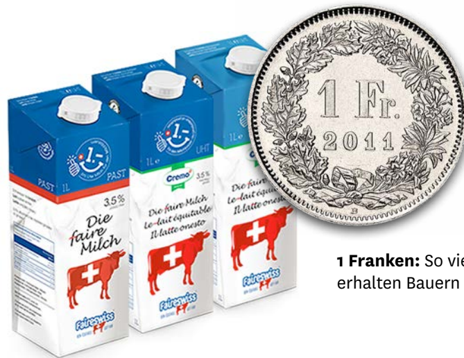
1 Franken: So viel erhalten Bauern pro Liter

Nicht nur beim bargeldlosen Zahlen in Läden fallen Gebühren an (saldo 13/2021). Banken und Zahlungsabwickler profitieren auch vom Spendengeschäft. Bei der Glückskette zum Beispiel gingen bislang 115 Millionen Franken an Spenden für die Opfer des Ukraine-Kriegs ein. Laut der Stiftung, die Geld für Kriegs- und Katastrophenopfer sammelt, machen die Gebühren für Spenden via Twint, Paypal, Kreditkarten und die digitale Sammelplattform iRaiser im Durchschnitt zwei Prozent des gespendeten Betrags aus. Aktionäre von Twint sind die Credit Suisse, die Raiffeisenbank, die UBS, die Zürcher Kantonalbank, die Banque Cantonale Vaudoise und die Postfinance. Tipp: Bei Spenden per Direktüberweisung via E-Banking fallen keine Gebühren an. js