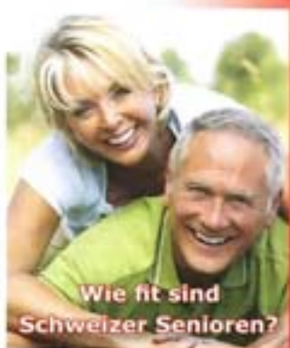
Wie fit sind Schweizer Senioren?

MACHEN SIE MIT UND VERHELFFEN SIE IHREM KANTON ZUM SIEG